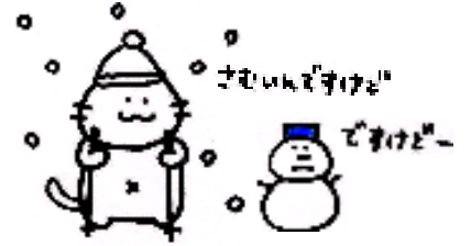
冬スノーシュー (雪上ウォーキング)