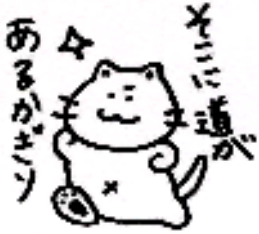
春夏はウォーキング