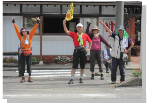
後日、30キロやりました。