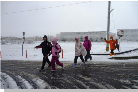
名前のとおりになっちゃいました...