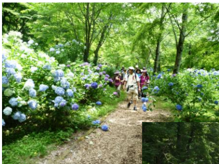
↑ あじさい小路 (かすみが城)

いつぐらいが見頃なのかなーとつぼみを探すが つぼみ見当たらず Σ(□□;) なにー!?